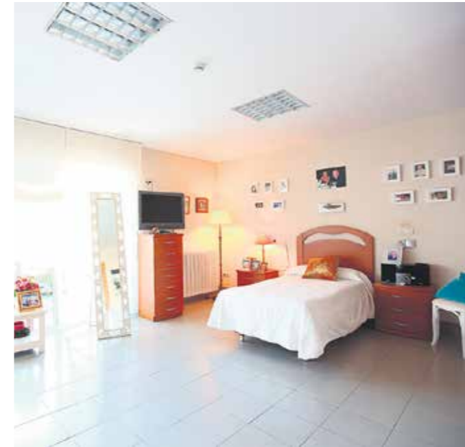
En estas fotos, vemos algunos espacios de las unidades de convivencia, que buscan ambientes hogareños, un modelo que trae consigo grandes beneficios para las personas usuarias.

que una de las personas usuarias no puede hacer, lo que una vez acabó mal, lo que nos da miedo...), sorprende un lugar en el que se hacen tantas cosas y sin perder de vista que nada es para todos, pues todos somos únicos y así se valora cada ingreso, partiendo de la historia de vida para recopilar la información relevante que se trasladará con el máximo respeto al día a día de los cuidados en el centro. Tras comer en el restaurante Intxaurreondo, iniciamos viaje de regreso a Asturias, finalizando así un día muy intenso de aprendizaje e intercambio de experiencias con compañeros del sector.