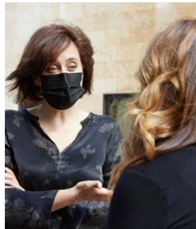
La Dra. Gral. de Planificación, Ordenación y Adaptación al Cambio Social, en el exterior de la Consejería.

Las prioridades se mantienen. Lo único que ha cambiado es que dentro de ese plan que teníamos trazado se ha cruzado una pandemia mundial a la que hemos tenido que hacer frente y que nos ha llevado a gestionar en un marco de incertidumbre. Es más, la pandemia ha venido también a corroborar que nuestras prioridades eran ciertas. El cambio social es una realidad y pongo un ejemplo, ¿se parecen en algo las necesidades de una persona que hoy tiene 75 años a las que tenía una persona de su edad hace dos décadas? Poco o nada. Y ahí es donde fijamos el foco, en ser capaces de dar respuesta a esas necesidades. No partimos de cero, Asturias se ha convertido por méritos propios en una de las mejores regiones de Europa para envejecer y además, para hacerlo de una forma saludable y activa. Así lo corrobora el Reference Site,