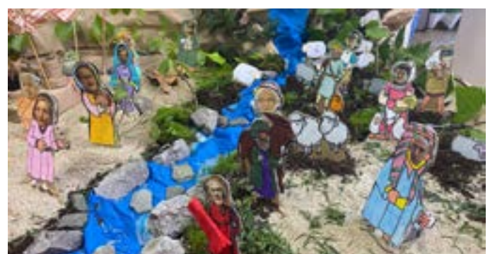
Segundo premio: Centro de Día Güelinos