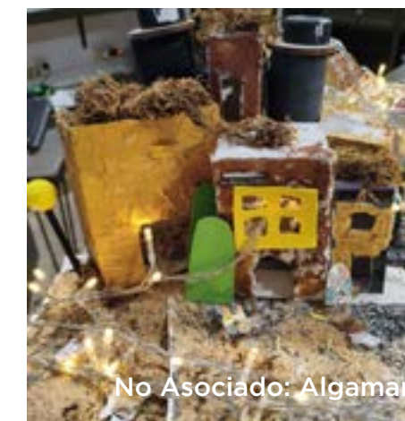
No Asociado: Algamar