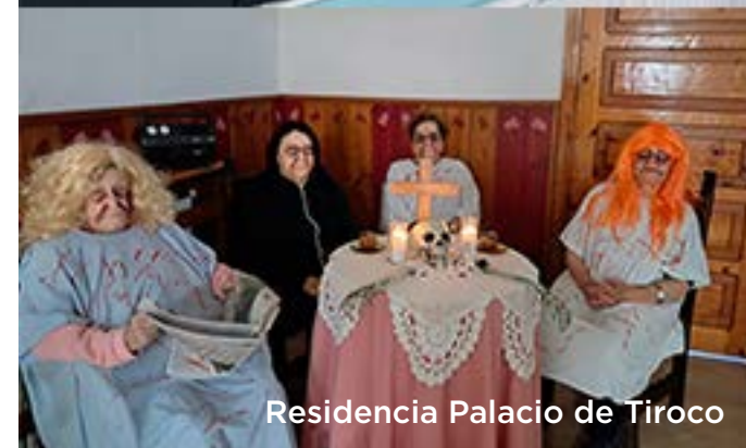
Residencia Palacio de Tiroco

En AARTE, nuestra meta es clara: dinamizar los centros e incrementar la participación de las personas usuarias en actividades que rompan la rutina. En este concurso nos centramos en la decoración, reconociendo lo importante que es personalizar el espacio donde se vive y adaptarlo a las celebraciones relevantes.