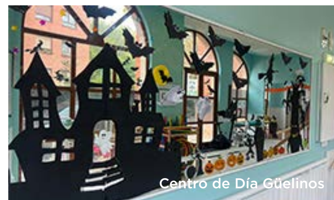
Centro de Día Güelinos