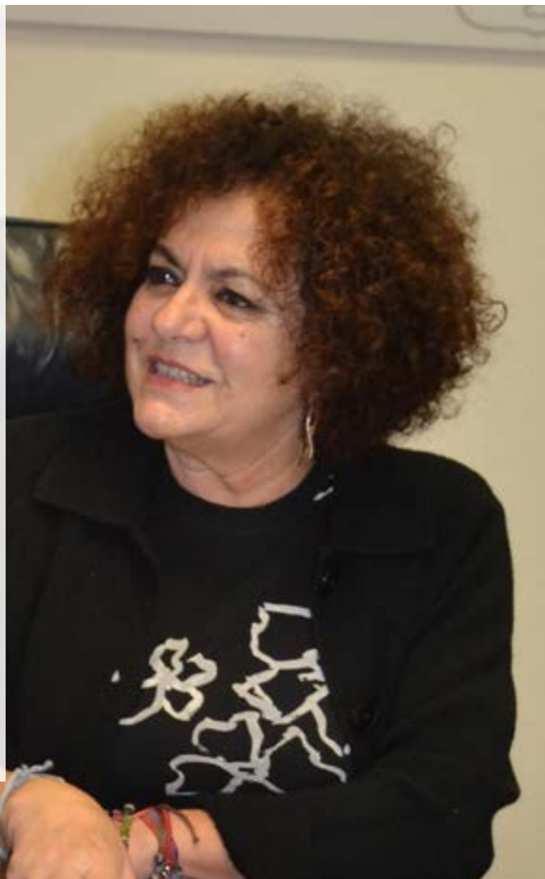
MARTA DEL ARCO FERNÁNDEZ CONSEJERA DE DERECHOS SOCIALES Y BIENESTAR

“Nuestro compromiso es avanzar hacia una Administración más ágil, que acompañe al sector en este cambio de modelo y no lo frene por cuestiones burocráticas”