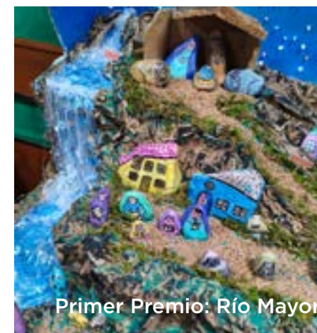
Primer Premio: Río Mayor