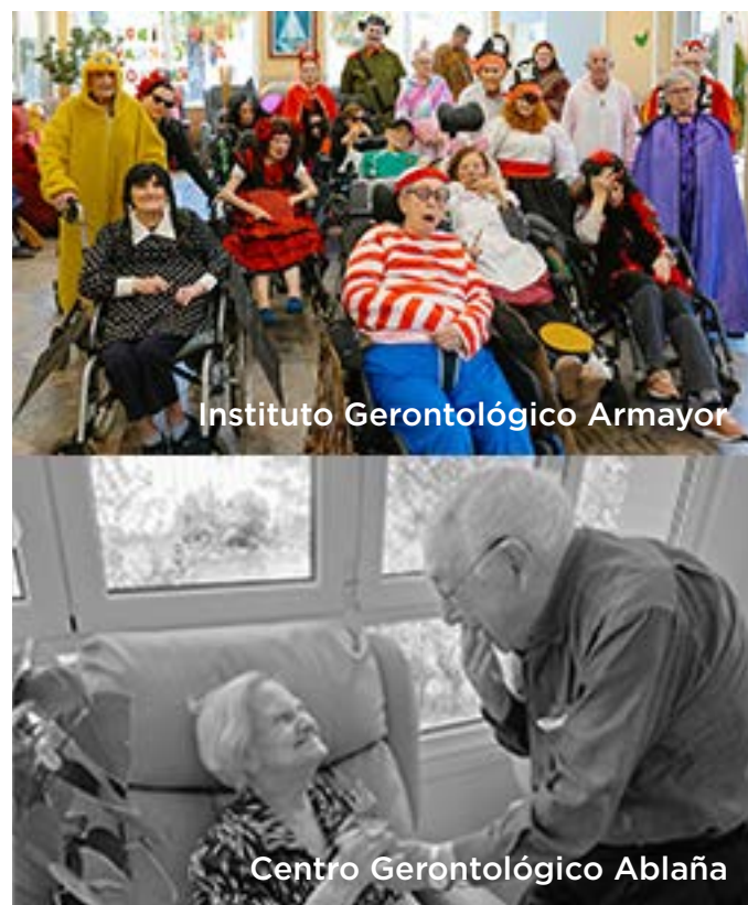
Instituto Gerontológico Armayor

Vuestro apoyo es fundamental para seguir cambiando la narrativa sobre la atención a las personas mayores.