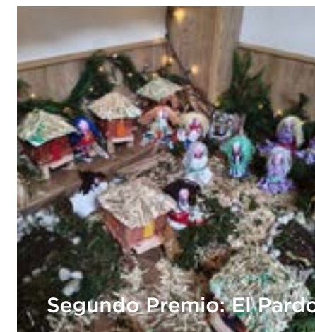
Segundo Premio: El Pardo